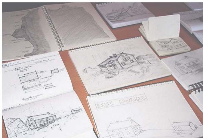
Die Claridenhütte von allen Seiten eingefangen.