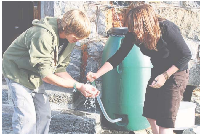
Morgentoilette mit fliessend Wasser ab Regenfass.